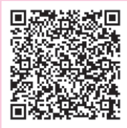
広報いずみおおつ